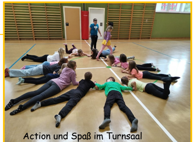
Action und Spaß im Turnsaal