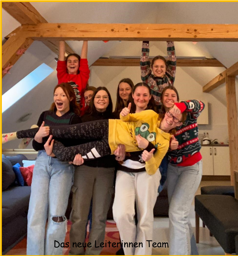
Das neue Leiterinnen Team

Die Jungschar Ferschnitz präsentiert sich seit einigen Monaten mit einem neuen Leiterinnen-Team und vielen coolen Kids, die keine Jungscharstunde verpassen wollen.