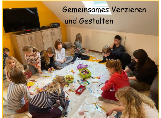
Gemeinsames Verzieren und Gestalten

Wir freuen uns, wenn auch DU das nächste Mal dabei bist.“